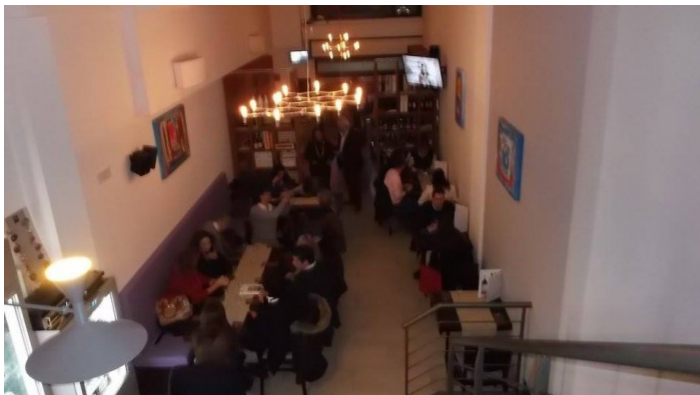
L'Alchimista, serata di degustazione

Ogni bottiglia ha un suo motivo, una bella storia da raccontare. Dietro ogni produzione c'è sempre qualcuno che ha deciso di creare qualcosa di unico. E questi sono sempre