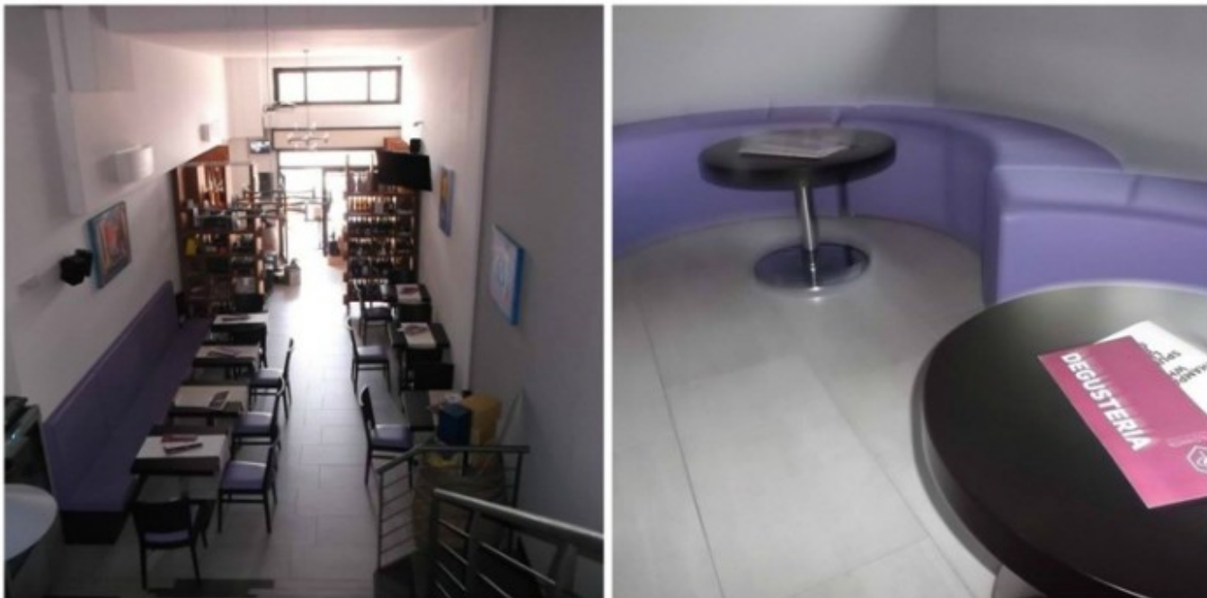
L'Alchimista, vista dall'alto e salottino