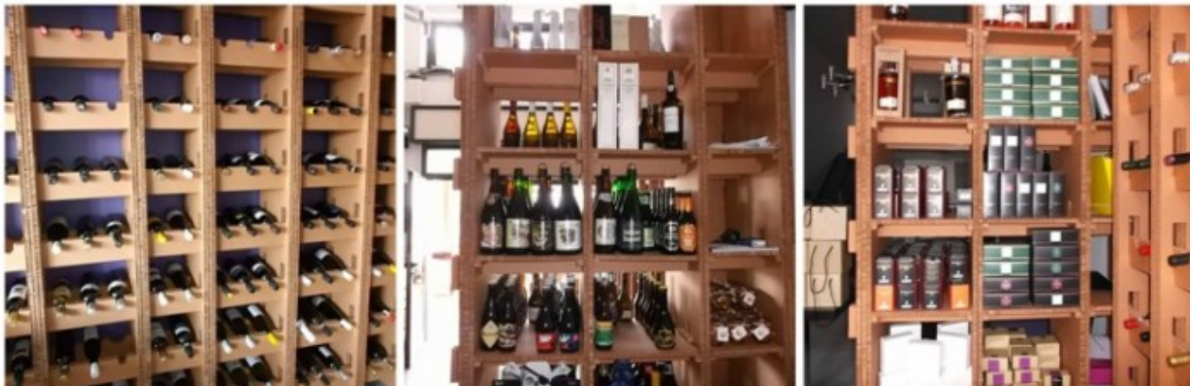
L'Alchimista, vini, birre artigianali e tè pregiati