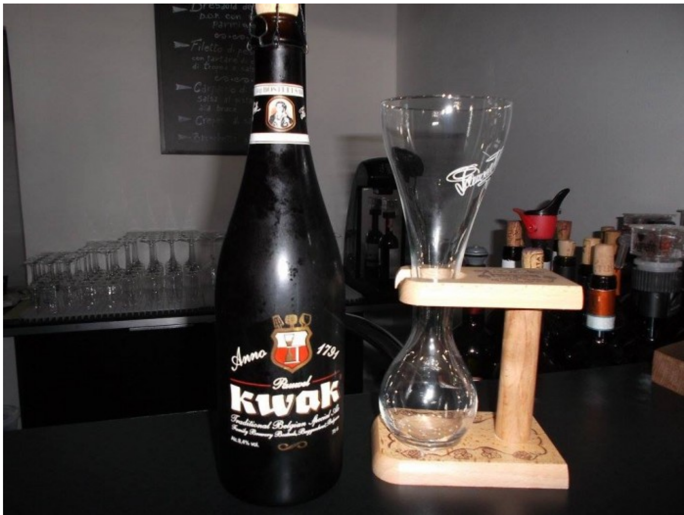
L'Alchimista, birra Kwak

L'enoteca si chiama "L'Alchimista - Vineria - Birreria - Degusteria" ed è fornita di circa 450 etichette di vini di eccellenza nazionali ed esteri; 70 marchi di ottima birra artigianale; selezionate bottiglie di superalcolici straniere ed italiane; pregiate bustine di the di tutto il mondo; e molteplici specialità gastronomiche tradizionali cilentane, italiane ed estere di assoluta qualità. Inoltre, si servono in accompagnamento al vino cibi gustosi e genuini della cucina cilentana ed extraregionale, insieme con i prodotti di alta pasticceria di Pietro Macellaro e di altri esponenti nazionali. L'ambiente è rilassante e discreto, con un salottino al piano superiore adatto per un intimo tete-a-tete.