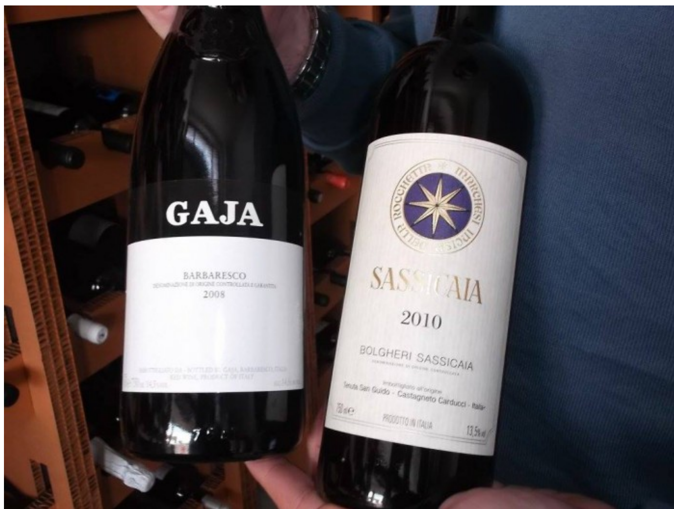
L'Alchimista, Barbaresco di Gaja e Sassicaia